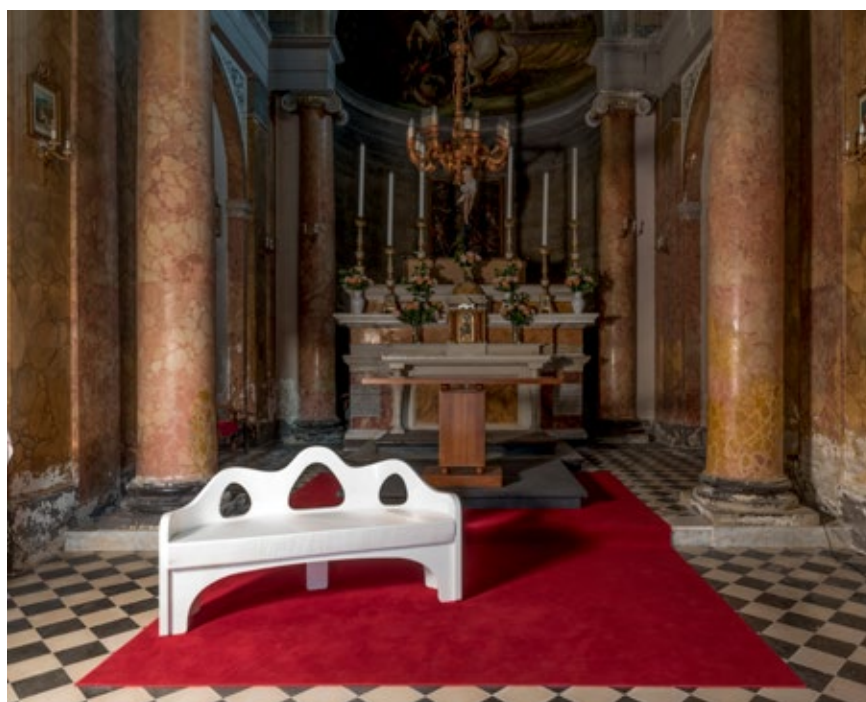
Peccioli, Chiesa delle Serre, racconto di Mauro Covacich

con EMONS Libri&Audiolibri, queste storie tornano al luogo che le ha generate e trovano modalità di ascolto attraverso sei nuove opere concepite appositamente da Vittorio Corsini e installate all'interno del Campanile della Chiesa di San Verano, della Chiesa della Madonna del Carmine e della Chiesa delle Serre a Peccioli, nella Chiesa di San Giorgio a Cedri, nella Cappella dei Santi Rocco e Sebastiano a Fabbri- ca, nell'Oratorio della Santissima Annunziata a Ghizzano. Voci si colloca perfettamente nel percorso di riqualificazione del centro storico e delle frazioni del Comune, con un salto di qualità, perché all'arte contemporanea si affianca l'arte letteraria, attraverso i racconti di nomi importanti della letteratura italiana attuale.